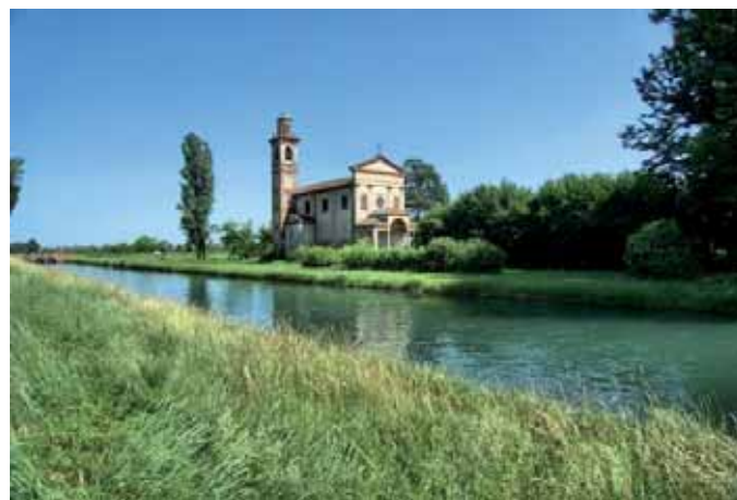
Il Canale Vacchelli in località "Moso" (Bagnolo Cremasco)