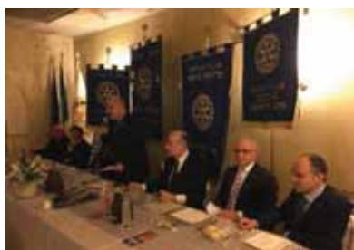
Il tavolo presidenziale