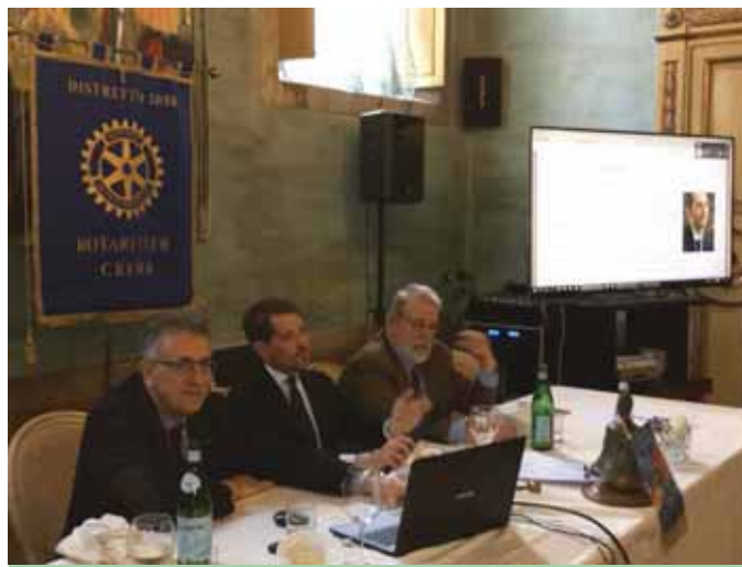
Il tavolo presidenziale durante la relazione via Skype