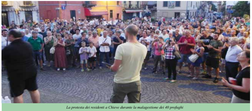
La protesta dei residenti a Chieve durante la malagestione dei 40 profughi

za". Ciò non è altro che un escamotage per fare in modo che venga gestito bypassando le leggi ordinarie". Secondo: "Va bene gettare ponti. Ma, per farlo, prima dobbiamo essere sicuri che non vi transitino persone imbottite di tritolo e che i pilastri da cui sono sostenuti siano solidi. Vale a dire che è necessario conoscere bene la nostra identità e non distruggerla, come per esempio accade quando qualcuno si straccia le vesti per una benedizione pasquale nella scuola". Terzo: "In Italia è difficile invertire tendenze deviate perché spesso sono in troppi a guadagnarci, nel senso più bieco del termine". Ciò nonostante, ha concluso Giordano, "la rassegnazione è un lusso che non possiamo permetterci".