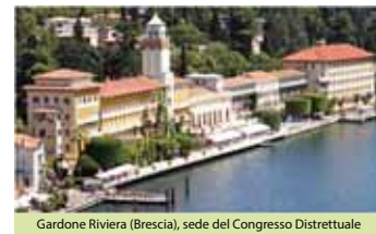
Gardone Riviera (Brescia), sede del Congresso Distrettuale

Concludo ricordando che il tema dell'anno "Essere dono nel mondo", scelto dal presidente Ravi, sarà di supporto alla nostra azione umanitaria anche dopo il 30 giugno poiché, si sa, "il motto è per un anno, ma il servizio rotariano è per sempre". Con questo spirito e in stretta continuità, ci prepariamo dunque a vivere un nuovo anno rotariano, salutano il Presidente Internazionale Eletto John Germ, il Governatore Eletto Angelo Pari, e mettendo in pratica il motto del nuovo anno "Il Rotary al servizio dell'umanità". Un caloroso abbraccio e un grazie per meritare il Rotary.