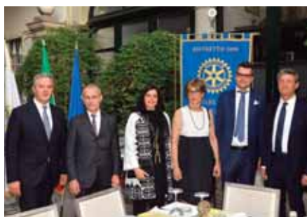
30 MAGGIO ingresso dei nuovi soci