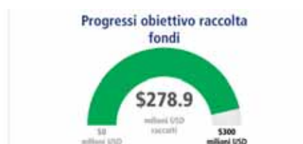
100 anni Fondazione Rotary: i soci del Club hanno deciso di donare un contributo straordinario aggiuntivo di 25 dollari a testa per contribuire alla raccolta fondi finalizzata a realizzare i progetti del centenario.