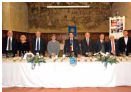
13 DICEMBRE sala Da Cemmo: la conviviale natalizia